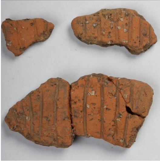
Goldach Mühlegut SG, Wandfrag- mente eines Topfs, mit parallelen Rillen, Mittelbronzezeit, KASG