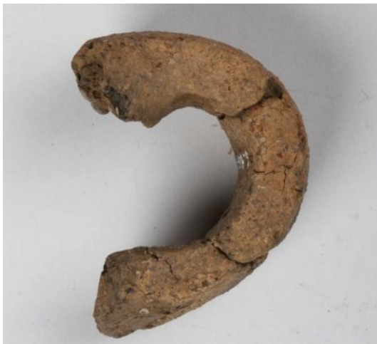
Goldach Mühlegut SG, Bandhenkel eines Topfs, Spätbronzezeit, KASG