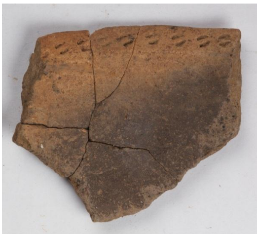
Goldach Mühlegut SG, Randfragment einer konischen Schale mit gestempel- tem Rand, Spätbronzezeit, KASG