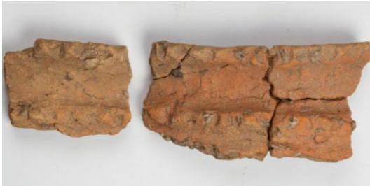
Goldach Mühlegut SG, Randfrag- mente eines Topf (?) mit zwei Fingertupfenleisten, Mittelbronze- zeit, KASG