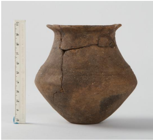
Goldach Mühlegut SG, Schulterbecher mit horizontalen Zierrillen, Spätbron- zezeit, KASG