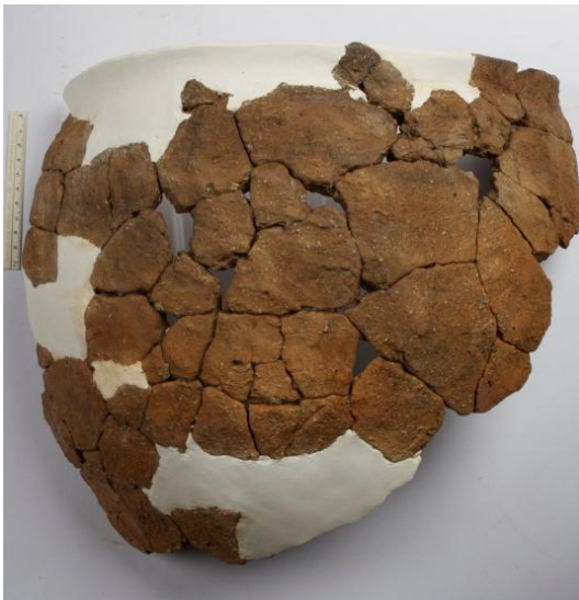
Goldach Mühlegut SG, Topf (rek- onstruiert), Mittelbronzezeit, KASG